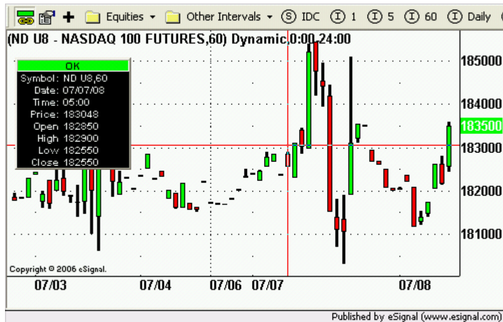
Grafica Diaria del Nasdaq 100