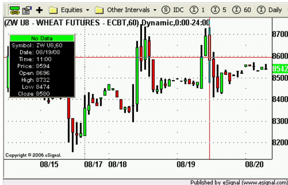
Grafica del Trigo de Septiembre

En el Chicago Board of Trade, en la pre apertura del mercado, el Trigo Septiembre opero con incrementos de nueve centavos, a $8.54 ¼ / bushel. El día de ayer, el Trigo cerró con perdidas. El mercado continua operando con un incremento en volatilidad. El mercado de Trigo ha seguido el movimiento del mercado de la Soya y en parte, también ha seguido el movimiento del mercado de Crudo. En el termino corto, parece que el mercado se esta consolidando.