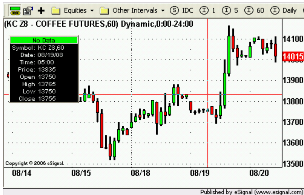
Café de Diciembre

A la hora 7:52 AM, el café para entrega en Diciembre opera sin mucho cambio, a $1.4015/libra. Al igual que el arroz, el mercado de Café, en los recientes días, el mercado de Café ha sostenido un rally.